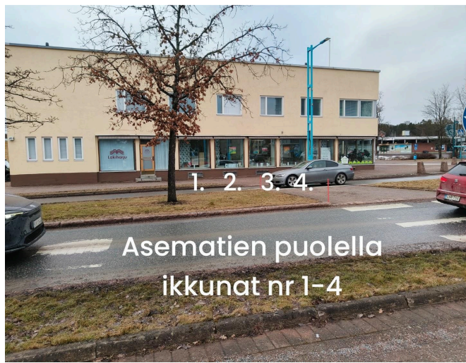
Asematien puolella ikkunat nr 1-4