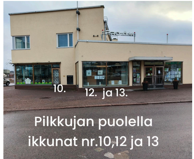
Pilkkujan puolella ikkunat nr.10,12 ja 13